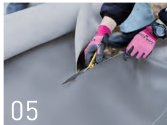
現場サイズに合わせて採寸