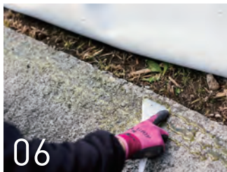
コンクリート部への接着剤塗布