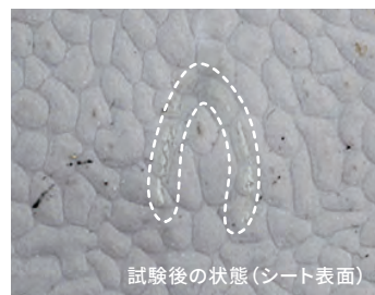
試験後の状態(シート表面)