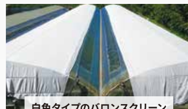
白色タイプのバロンスクリーン ホワイト涼風もございます