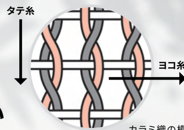
カラミ織の模式図