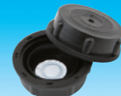
ガス抜きキャップ (ガス発生内溶液用)