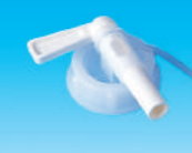
コックφ9mm (汎用タイプ)