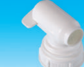
マキシフローコックφ18mm (液垂れ防止タイプ)