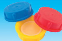
カラーキャップ (赤・青・黄)