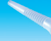
ワンタッチノズルφ17mm (さし込み式)