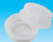
Eキャップ (ハッキングタイプ)