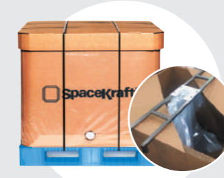
220ℓタイプもあります