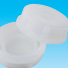
標準キャップ (汎用タイプ)