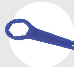
キャップオープナー (φ32用)