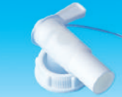
ジャンボコックφ19mm (高粘度内溶液用)