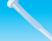
スクリーノズルφ17mm (キャップ式)