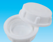
Nキャップ (内ブタなし)