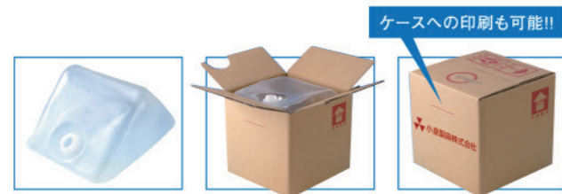
ケースへの印刷も可能!!