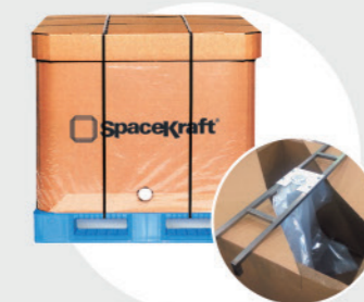
220ℓタイプもあります