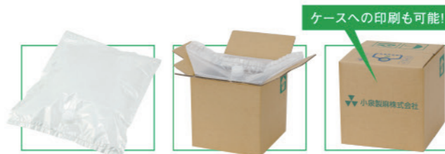
ケースへの印刷も可能!!

多層品の αシリーズ は、 バリア材 の採用により、物質の透過を低減するので、容器外部からの酸素や臭気の侵入による 品質劣化の防止 、内容物の 香り保持 など食品や化粧品分野に適し、食品の 賞味期限の延長 にも繋がります。