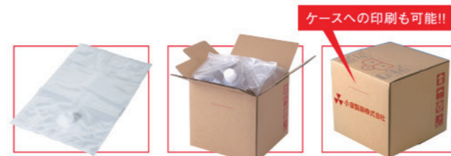
ケースへの印刷も可能!!