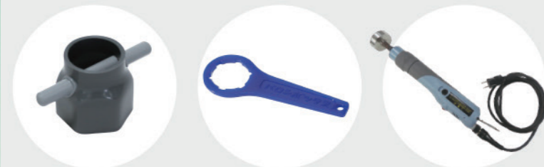
キャップ締め具 (塩ビ加工)