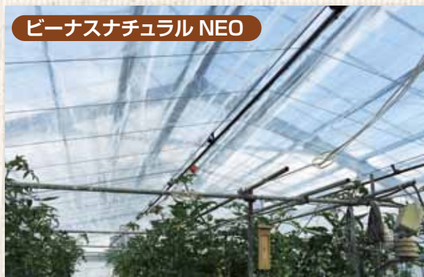
ビーナスナチュラルNEO