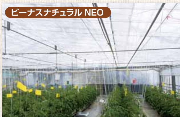
ビーナスナチュラルNEO