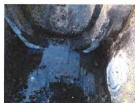
↑ 施工後 (目地)