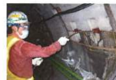
↑ 高圧樹脂注入イメージ