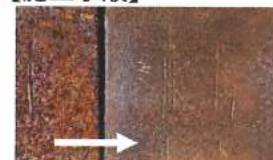
①下地清掃とケレン