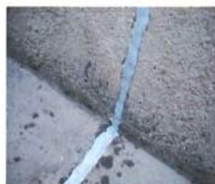
↑ 施工後 (目地)