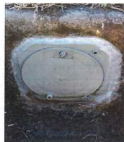
↑ 施工後 (分水栓)