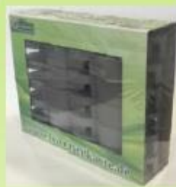
ベーシックブロック 12個梱包例