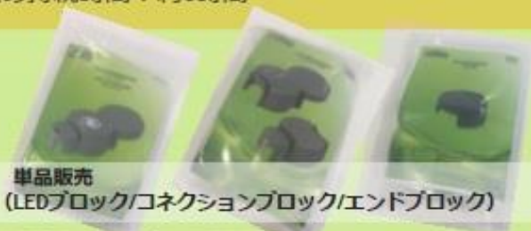
単品販売 (LEDブロック/コネクションブロック/エンドブロック)

長さ：約10cm 幅：10cm 高さ：5cm 販売基本パッケージ：1ブロック（約8g）